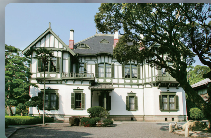
西日本工業倶楽部

7月1日(水) 10:00よりチケット発売 ※予約・購入方法の詳細はチラシ裏面を ご確認ください