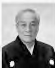
能楽金剛流26世宗家 人間国宝 金剛 永謹

1951年能楽金剛流25世宗家金剛巖の長男として京都に生まれる。4歳で初舞台を踏み、6歳で初めてシテを演じる。1998年金剛流26世宗家を継承。カナダ、アメリカ、イタリア、スペイン、フランス等の海外公演も多数。2018年紫綬褒章受章。2023年重要無形文化財保持者(人間国宝)に認定。フランス芸術文化勲章オフィシエ受賞。京都市立芸術大学客員教授。著書に『金剛宗家の能面と能装束』がある。